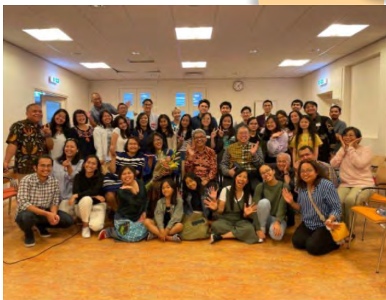
Groepsfoto verwelkoming van nieuwe Indonesische studenten. De Vice Ambassadeur van Replublik Indonesia en echtgenote waren ook aanwezig.