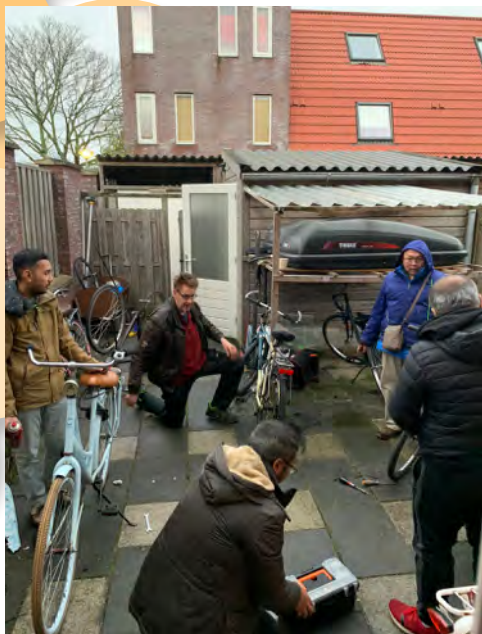
Reparasi sepeda bekas, agar siap pakai

studenten in Nederland de volledige vrijheid krijgen om hun eigen kerk te kiezen).