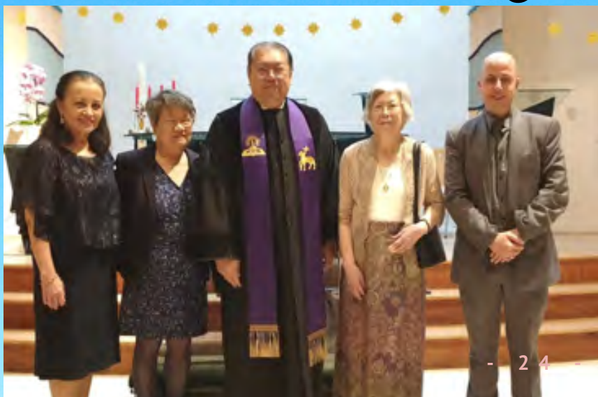
T I N E D E G R O O T ( T W E E D E V A N R E C H T S )

APA PENDAPAT ANDA? APAKAH BILINGUALISME G K I N MERUPAKAN BEBAN ATAU BERKAH? APAKAH BILINGUALISME MENGHAMBAT FUNGSI? APAKAH ORANG BELANDA DENGAN SUAMI ATAU ISTRI INDONESIA JUGA HARUS BERUSAHA UNTUK BELAJAR BAHASA INDONESIA? ATAU HARUSKAH ORANG INDONESIA YANG TINGGAL DI BELANDA HANYA BERUPAYA UNTUK BENAR-BENAR BELAJAR BAHASA BELANDA DENGAN BAIK? KIRIM IDE ANDA TENTANG INI KE RDEFIJTER@HOTMAIL.COM